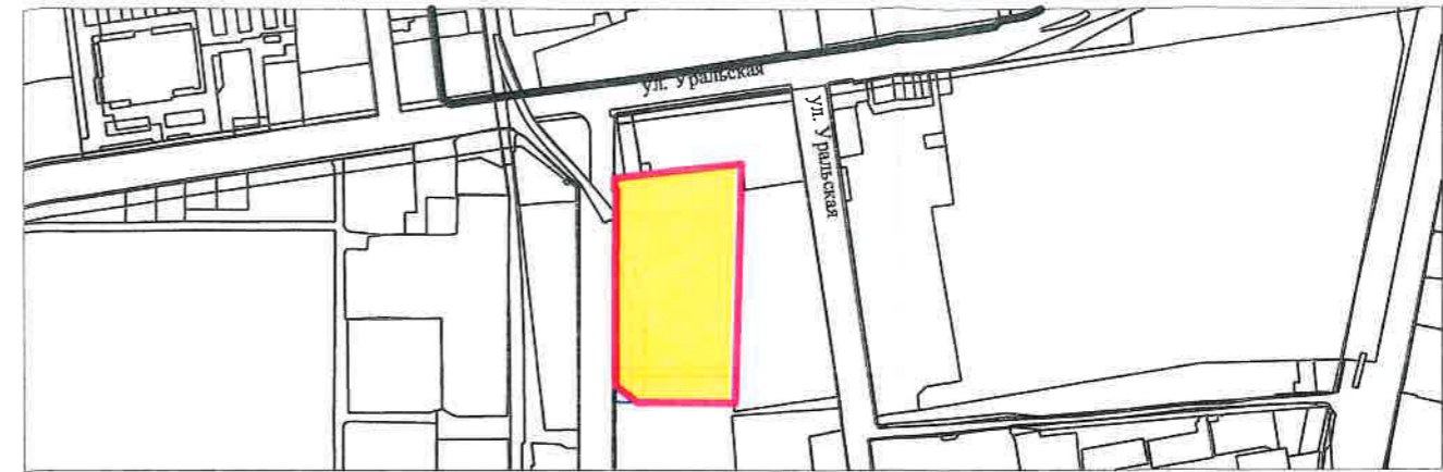
СХЕМА РАСПОЛОЖЕНИЯ ЗЕМЕЛЬНОГО УЧАСТКА В ОКРУЖЕНИИ СМЕЖНО РАСПОЛОЖЕННЫХ ЗЕМЕЛЬНЫХ УЧАСТКОВ (СИТУАЦИОННЫЙ ПЛАН)

Площадь земельного участка с КН 23:43:0403017:1416 - 13642 кв.м